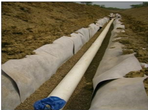
Continuación de canales terciarios