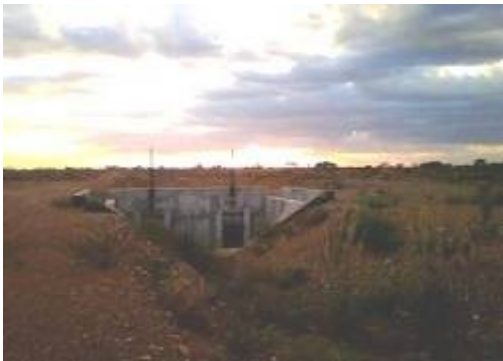
Continuación de canales secundarios