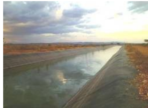
Continuación de canales secundarios