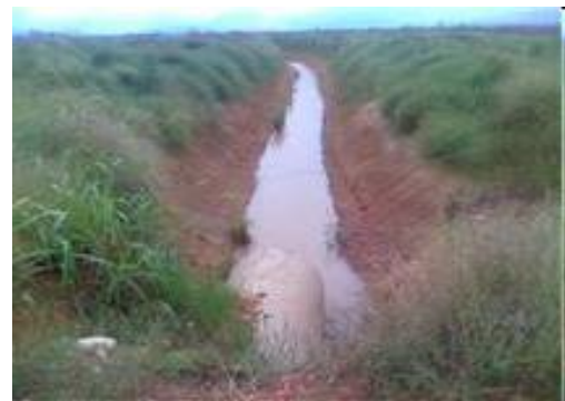
Construcción de drenaje en el sistema