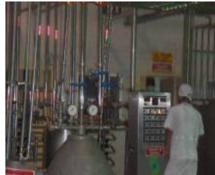
Planta Procesadora de leche de Elorza