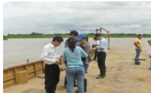
Construcción del Puente Apurito – San Antonio