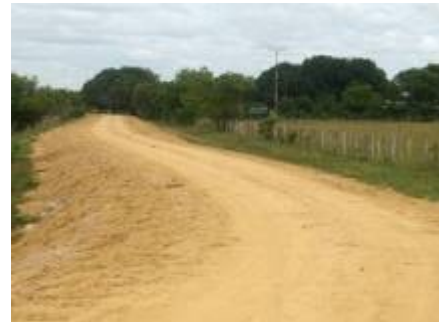
Modelos de terraplén vía a la Unidad de Producción Francisco Far Fan