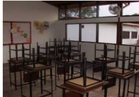
Modelo de Escuela para realizar en la Unidades de Producción Socialista